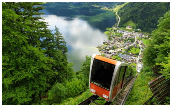
Seilbahn zu «Salzwelten Hallstatt»