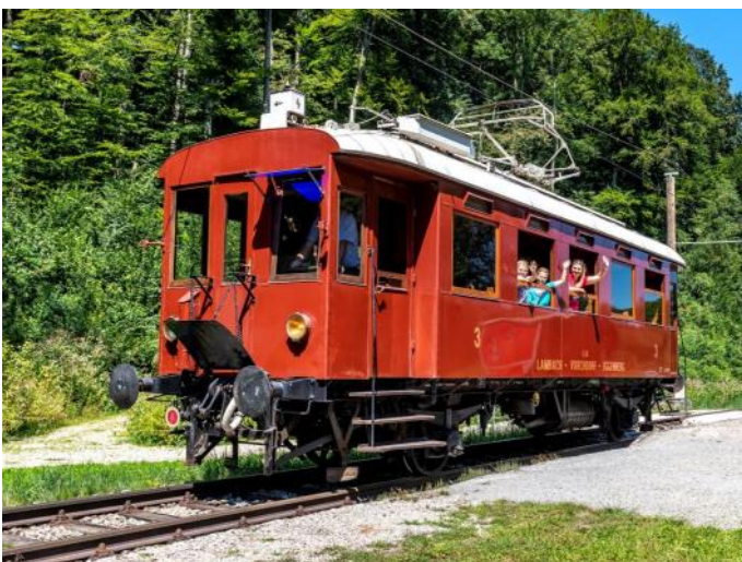
ET40 der Vorchdorferbahn *)

Unsere Ausflugsziele, ausgehend von Bad Ischl