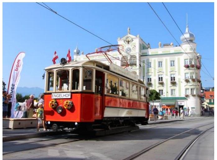
Tram Nr.5 in Gmunden *)